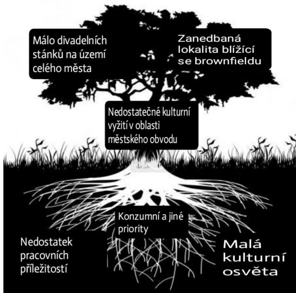
Obrázek č. 1 - Analýza rozvojového problému – Strom problému